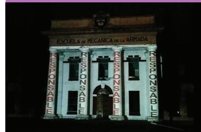
Autores: GAC - Grupo de Arte Callejero - Comisión por la Memoria de La Paternal, La Paternal No Olvida.

Las VI Jornadas "Espacios, lugares y marcas territoriales de la violencia política y la represión estatal" constituyen un ámbito interdisciplinario para problematizar y reflexionar sobre las diversas experiencias de espacialización de la memoria, tanto en nuestro país como en países vecinos.