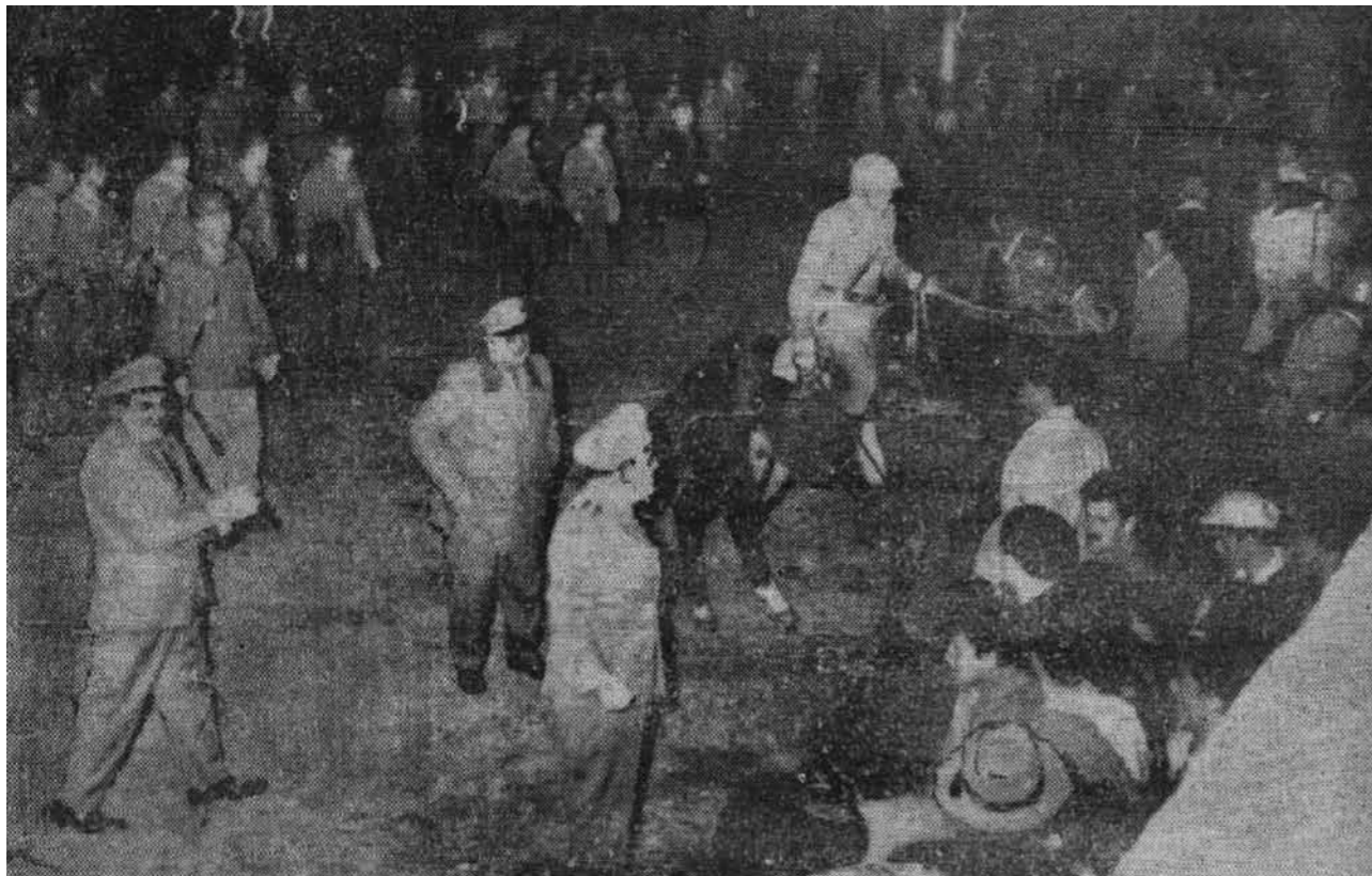
Imagen 1 (arriba). Imagen 2 (abajo).

Reproducción del diario El Popular , Uruguay: “La policía baleó a los cañeros. ¿Es esa la respuesta del gobierno al reclamo de tierras para trabajar?”, 8 de mayo de 1964, portada.