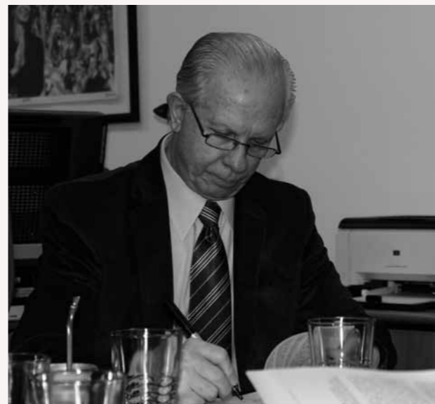
Firma del convenio entre la CPM, el INCAA, la Universidad de Quilmes y la Facultad de Periodismo de La Plata para el registro audiovisual del Juicio de La Cacha.

escuela de suboficiales. Fue en noviembre de 2006 y dijo que los nuevos oficiales que estaban estudiando tenían que llevar en sus manos la Constitución Nacional en un lado, y en el otro, la patria. Y, por otra parte, dijo que no tenían que cargar la mochila ensangrentada de los genocidas de la dictadura militar. Así que esos gestos políticos eran muy fuertes.